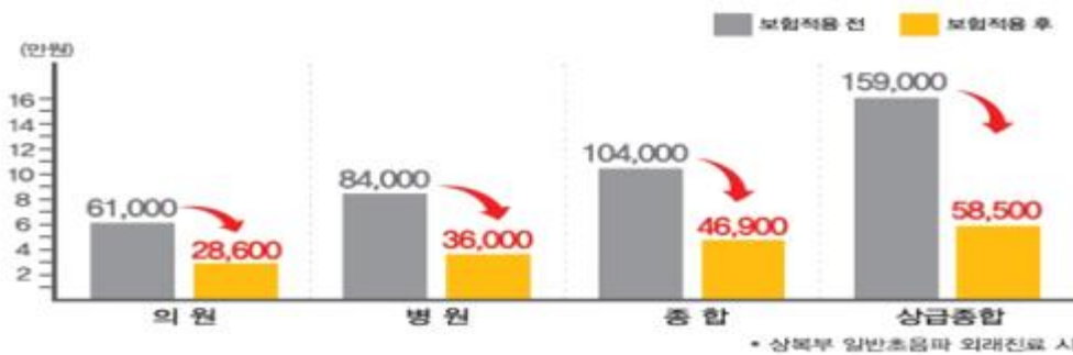
<상복부 초음파 급여화에 따른 의료비 부담 경감 효과>